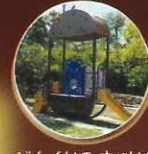
どんぐりのすべり台

収穫したほうき草で ほうきを作るイベント開催します! ※次号の市民の森だよりでお知らせします